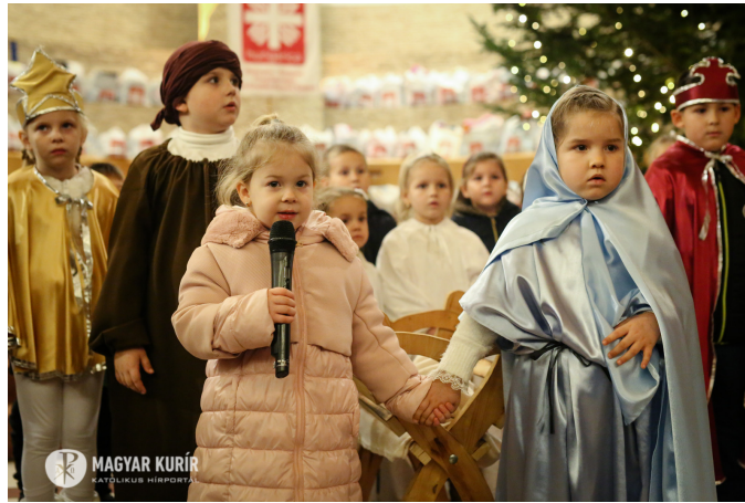
Krippenspiel bei der Weihnachtsbescherung in Budapest

Weihnachten ist kein Zeitpunkt und keine Jahreszeit, sondern eine Gefühlslage. Frieden und Wohlwollen in seinem Herzen zu halten, freigiebig mit Barmherzigkeit zu sein, das heißt, den wahren Geist von Weihnachten in sich zu tragen.